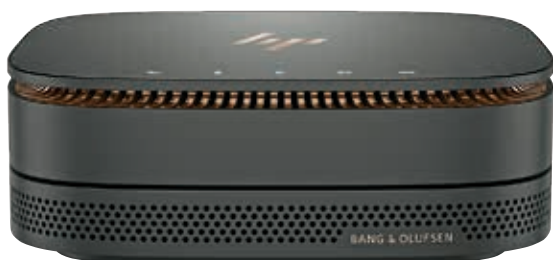
HP Elite Slice pour Salles de réunion comprend HP Elite Slice, le logiciel Intel® Unite™, HP Collaboration Cover et HP Audio Module. Les autres modules sont vendus séparément.

Démarrez vos réunions en souplesse grâce à la solution intégrée de conférence conçue pour le bureau du futur. Simple, sécurisée et facile à gérer, elle associe des commandes accessibles à l'aide d'une simple touche, Skype for Business™ et le partage sans fil d'Intel® Unite™, tout en ayant l'âme et la facilité de gestion d'un puissant ordinateur.