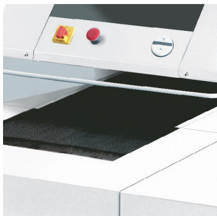
TABLE D'ALIMENTATION AVEC BANDE DE TRANSPORT

Lubrification automatique du bloc de coupe durant la destruction pour assurer un rendement régulier.